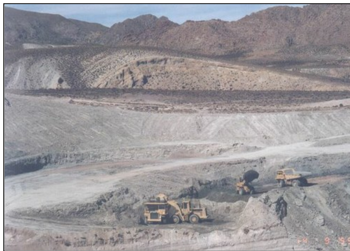
BAJO SOSPECHA / VISTA AEREA DE LA MINA BAJO LA